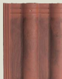
Prodot al unui competitor

Cu așa-numitul test al cărbunelui recunoscut pe plan internațional, suprafața Bramac Protector® a obținut un rezultat remarcabil: în comparație cu suprafața Protector®, pe materialele tradiționale de învelitoare rămân vizibil mai multe reziduuri (vezi fotografiile). Din portofoliul Bramac, modelele de țiglă Montero, Tectura, Romana și Alpina Clasic sunt disponibile cu suprafața Protector®. Pentru detalii cu privire la culori și pentru mai multe informații consultați www.bramac.ro .